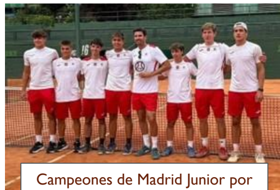
Campeones de Madrid Junior por equipos Masculino