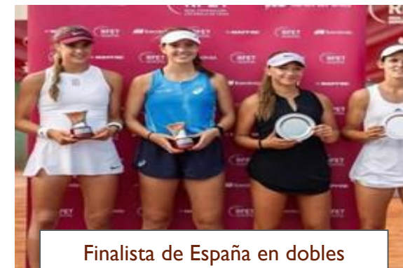
Finalista de España en dobles Femenino