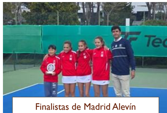
Finalistas de Madrid Alevín Femenino por equipos