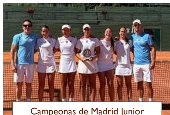
Campeonas de Madrid Junior Femenino por equipos