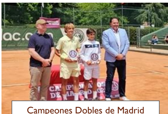
Campeones Dobles de Madrid Campeonato Infantil