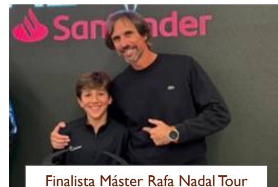
Finalista Máster Rafa Nadal Tour Alevín Masculino