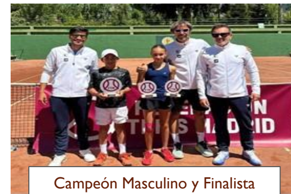
Campeón Masculino y Finalista Femenino de Madrid Alevín Indiv.