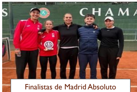
Finalistas de Madrid Absoluto Femenino por equipos