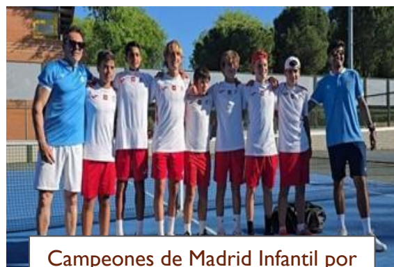
Campeones de Madrid Infantil por equipos Masculino