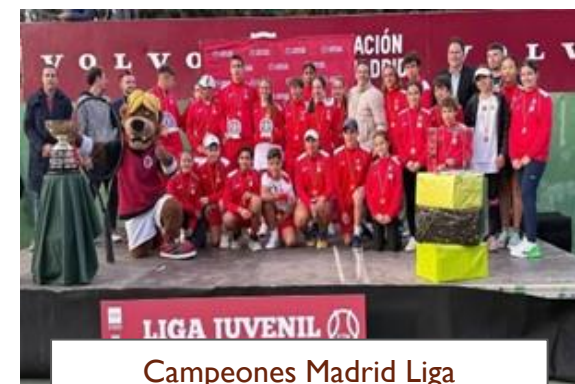
Campeones Madrid Liga Juvenil 1ª División