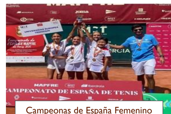
Campeonas de España Femenino por equipos