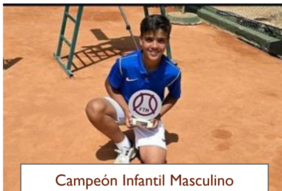
Campeón Infantil Masculino individual