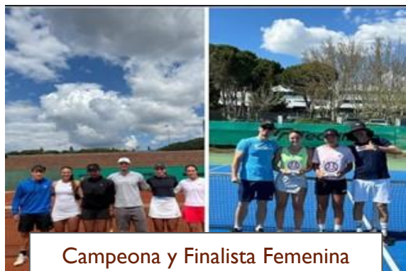
Campeona y Finalista Femenina Junior de Madrid