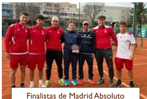
Finalistas de Madrid Absoluto Masculino por equipos