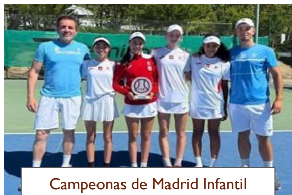
Campeonas de Madrid Infantil Femenino por equipos