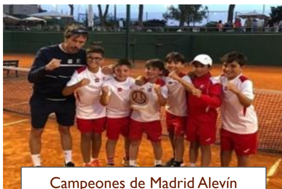
Campeones de Madrid Alevín Masculino por Equipos