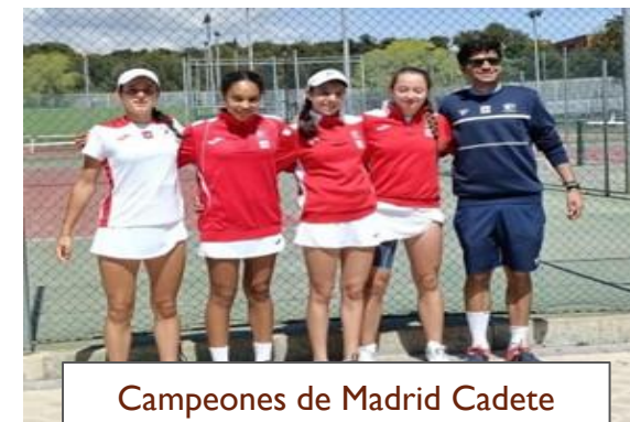
Campeones de Madrid Cadete Femenino por equipos