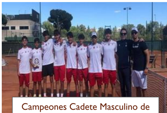
Campeones Cadete Masculino de Madrid por equipos