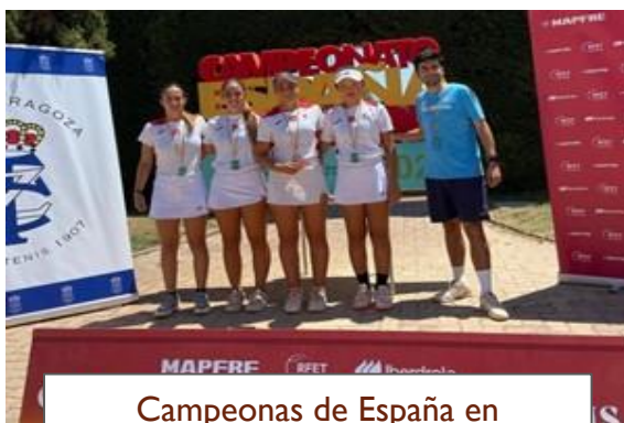
Campeonas de España en consolación Junior Femenino