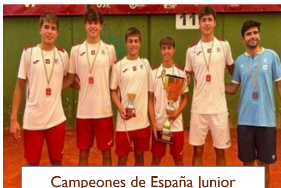
Campeones de España Junior Masculino por equipos