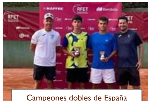
Campeones dobles de España Cadete Masculino