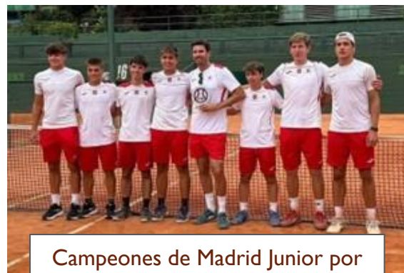
Campeones de Madrid Junior por equipos Masculino