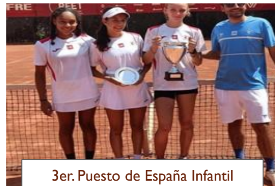
3er. Puesto de España Infantil Femenino por equipos