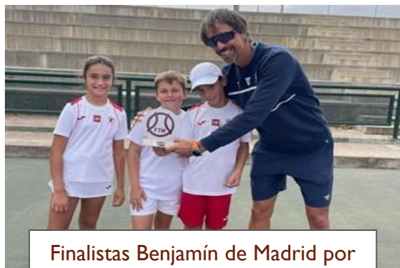
Finalistas Benjamín de Madrid por equipos